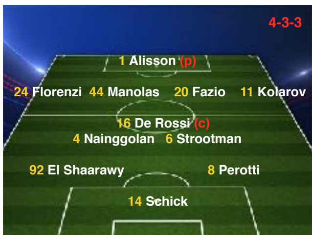
31/03/18 Bologna 1-1 Roma

A disp.: 28 Skorupski (p), 13 Capradossi, 5 Jesus, 25 Peres, 33 Silva, 3 Luca Pellegrini, 21 Gonalons, 23 Defrel, 30 Gerson, 9 Dzeko