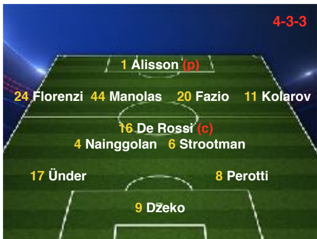
13/03/18 Roma 1-0 Shakhtar

A disp.: 28 Skorupski (p), 5 Jesus, 25 Peres, 30 Gerson, 7 Pellegrini, 92 El Shaarawy, 14 Schick