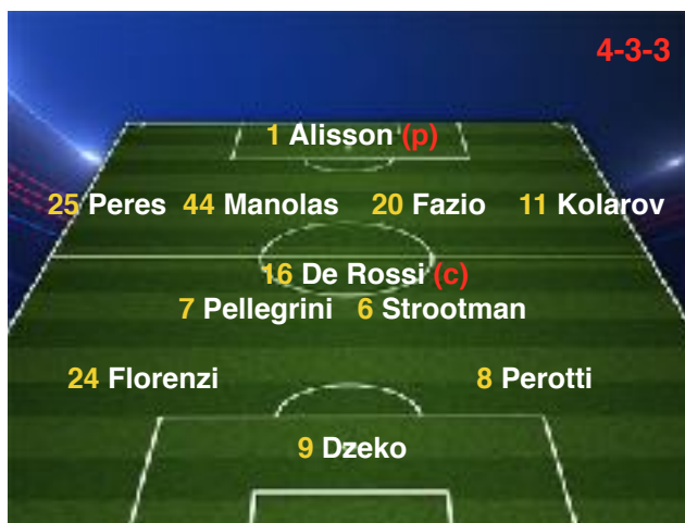
04/04/18 Barcelona 4-1 Roma

A disp.: 28 Skorupski (p), 5 Jesus, 30 Gerson, 21 Gonalons, 92 El Shaarawy, 14 Schick, 23 Defrel